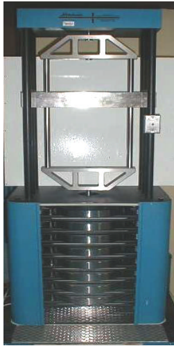
Patrón Nacional de Fuerza de 2,5 kN hasta 50 kN.