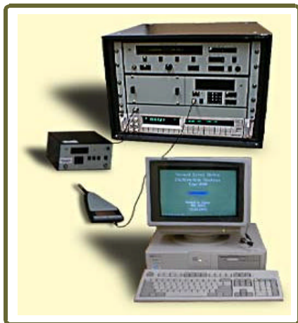
Patrón de Referencia Nacional para Sonometría

Unidad: nivel de presión acústica (dB referidos a 20 \times 10^{-6} Pa) Realización: es 20 veces el logaritmo de la razón entre la presión acústica medida y la presión acústica de 20 \times 10^{-6} Pa, definida como el umbral auditivo de referencia. Incertidumbre expandida: pruebas acústicas: Calibradores: 31,5 \text{ Hz a } 8000 \text{ Hz} \leq 0,3 \text{ dB} ( k=2 , con un nivel de confianza de aproximadamente 95%). sonómetros: 31,5 \text{ Hz a } 8000 \text{ Hz} \leq 0,6 \text{ dB} ( k=2 , con un nivel de confianza de aproximadamente 95%). pruebas eléctricas: 16 \text{ Hz a } 16000 \text{ Hz} \leq 0,2 \text{ dB} ( k=2 , con un nivel de confianza de aproximadamente 95%).