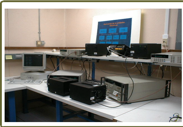
Sistema de medición para la intercomparación de Transferencias Térmicas

Unidad: volt (V) Realización: el patrón nacional de tensión en c.a. está formado por un conjunto de transferencias térmicas con las cuales se determina el valor eficaz de una tensión. Incertidumbre expandida: \pm 20 \times 10^{-6} en el intervalo de audio frecuencias, \pm 90 \times 10^{-6} a frecuencias de 1 MHz (k=2, con un nivel de confianza de aproximadamente 95%).